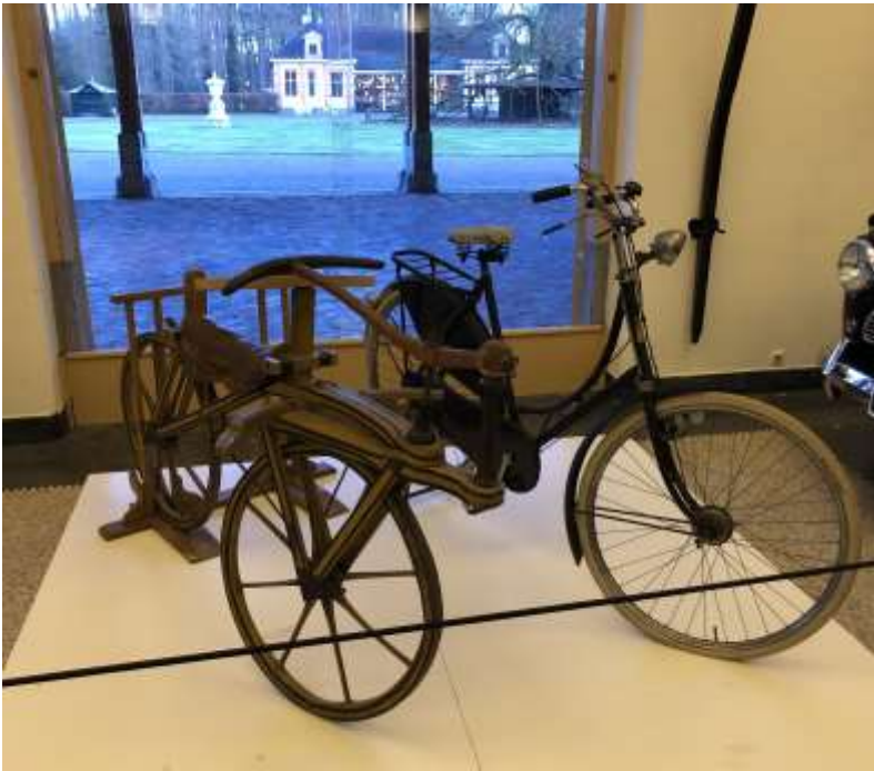
Tweewielers in de stallen van Paleis Het Loo