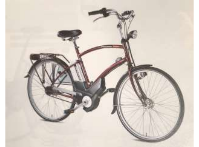
Sparta Pharos 1999