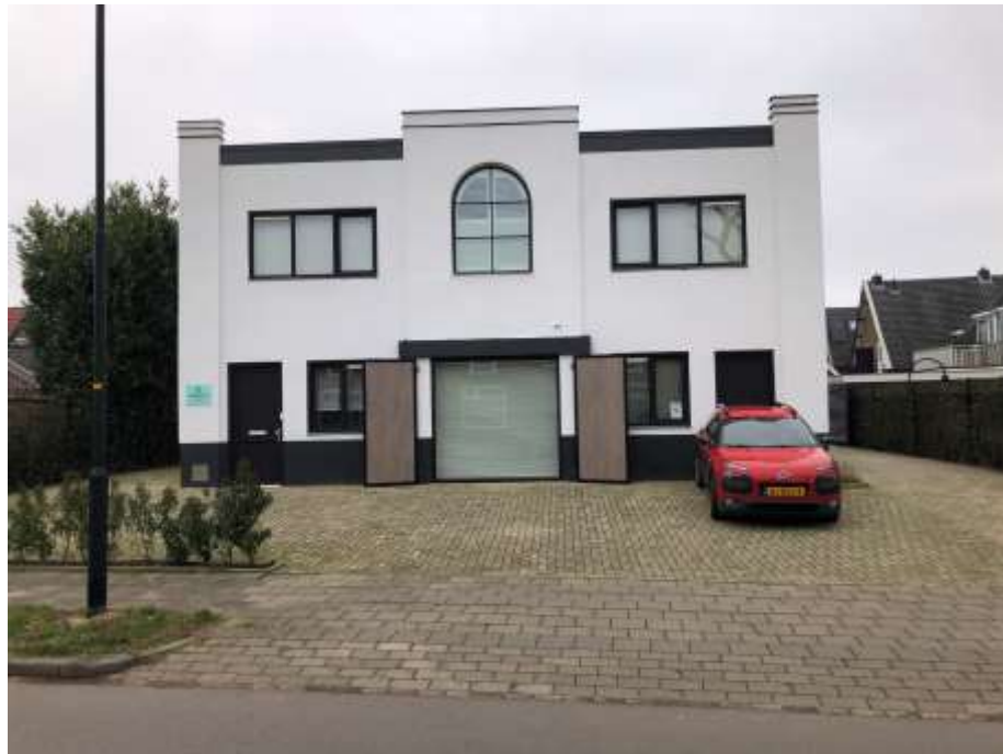
Voormalige fabriek Adelaarslaan 9