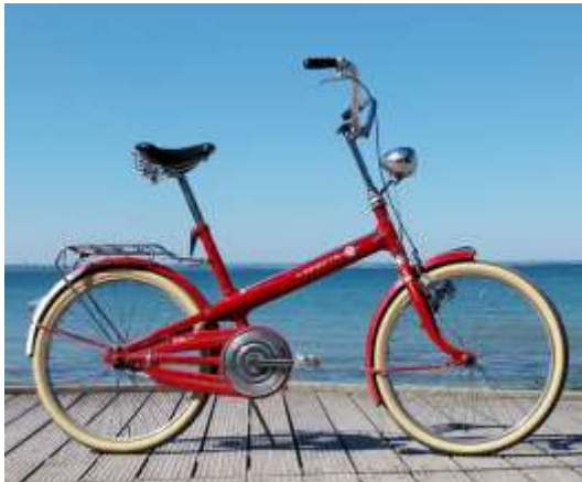
Sparta 8-80 (en 4-10)