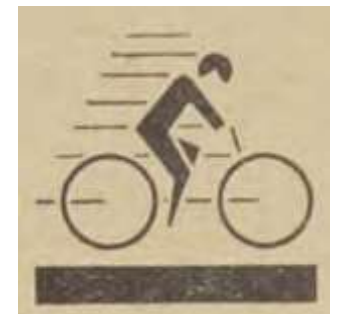
Beeldmerk gedeponeerd in 1934