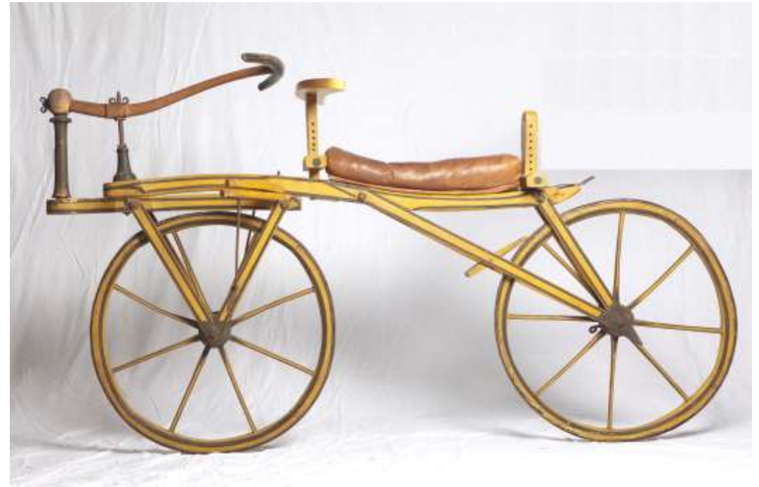
Draisine van ca. 1820