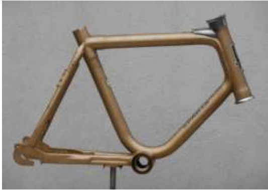
Frame uit één stuk