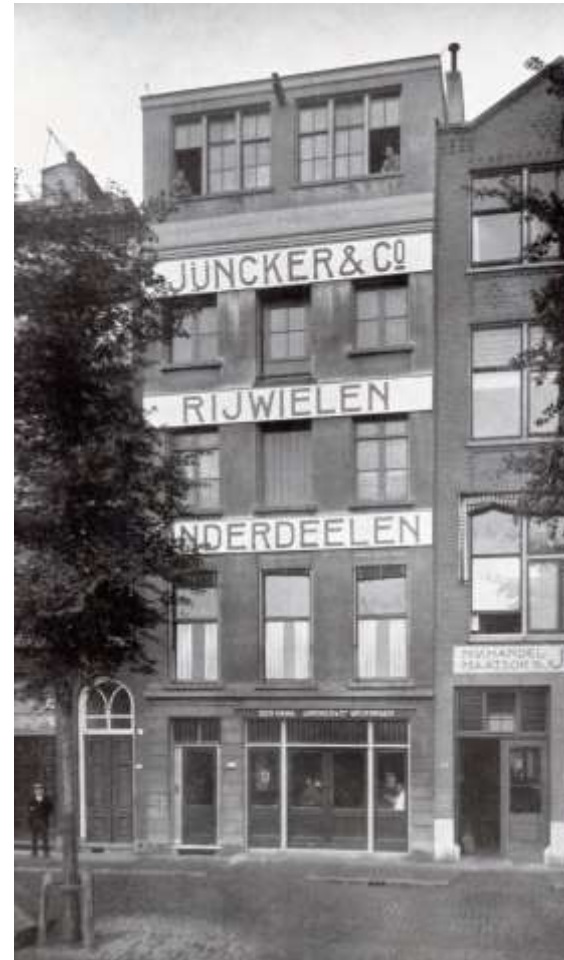
Fabriek Leuvehaven Rotterdam