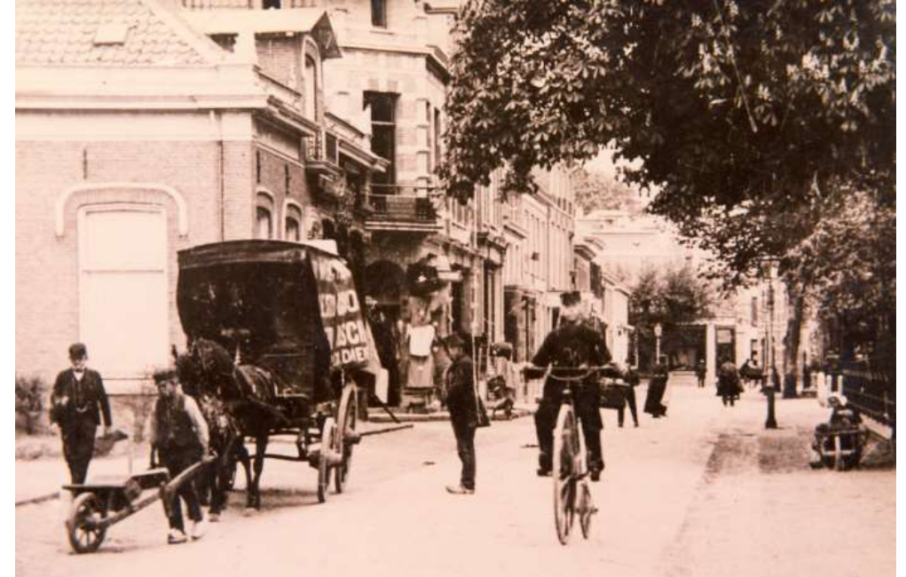
Dorpstraat-Hoofdstraat Apeldoorn ca. 1890