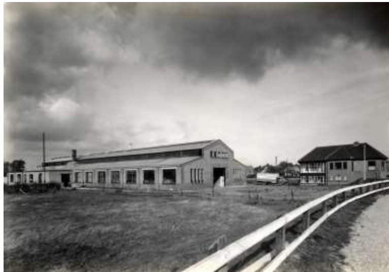
Fabriek Brinklaan Apeldoorn