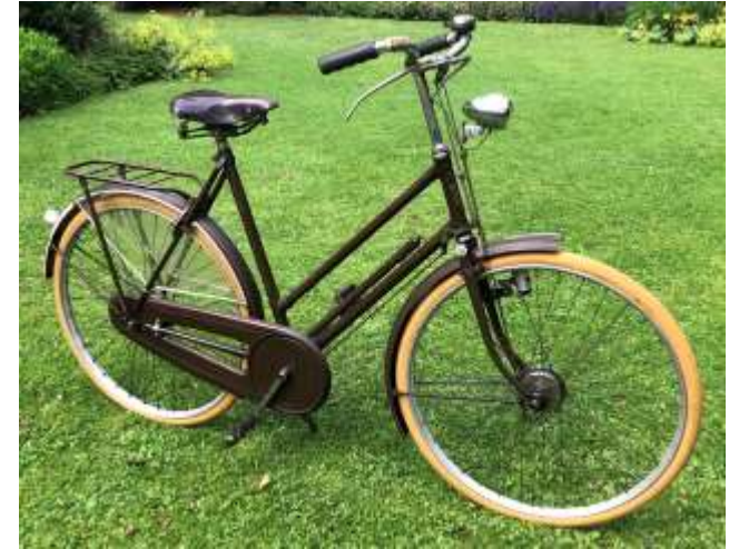
Juncker Paramount / Quickrun 1952