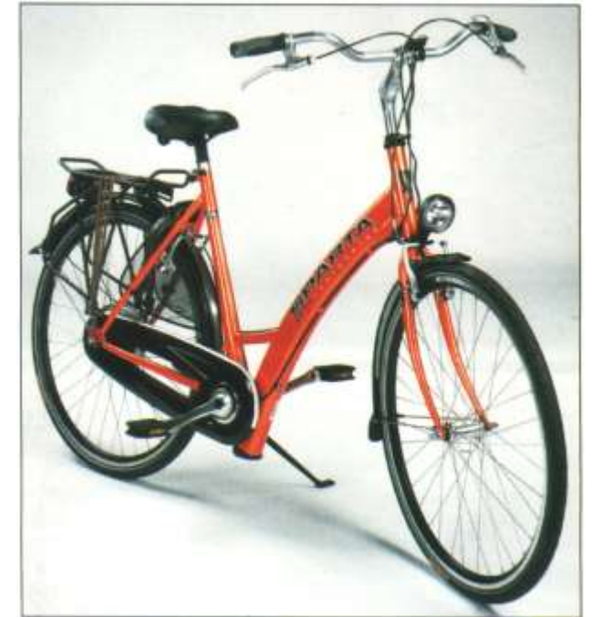
Sparta Ion 2003