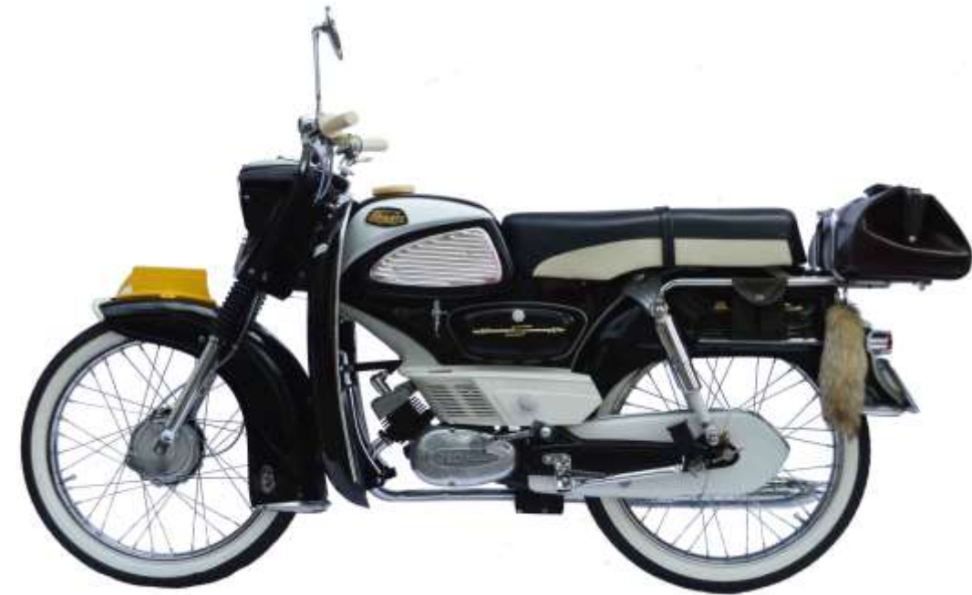
Sparta GI50 Sport, 1965.

Sparta was de grootste fabrikant van bromfietsen in Nederland.