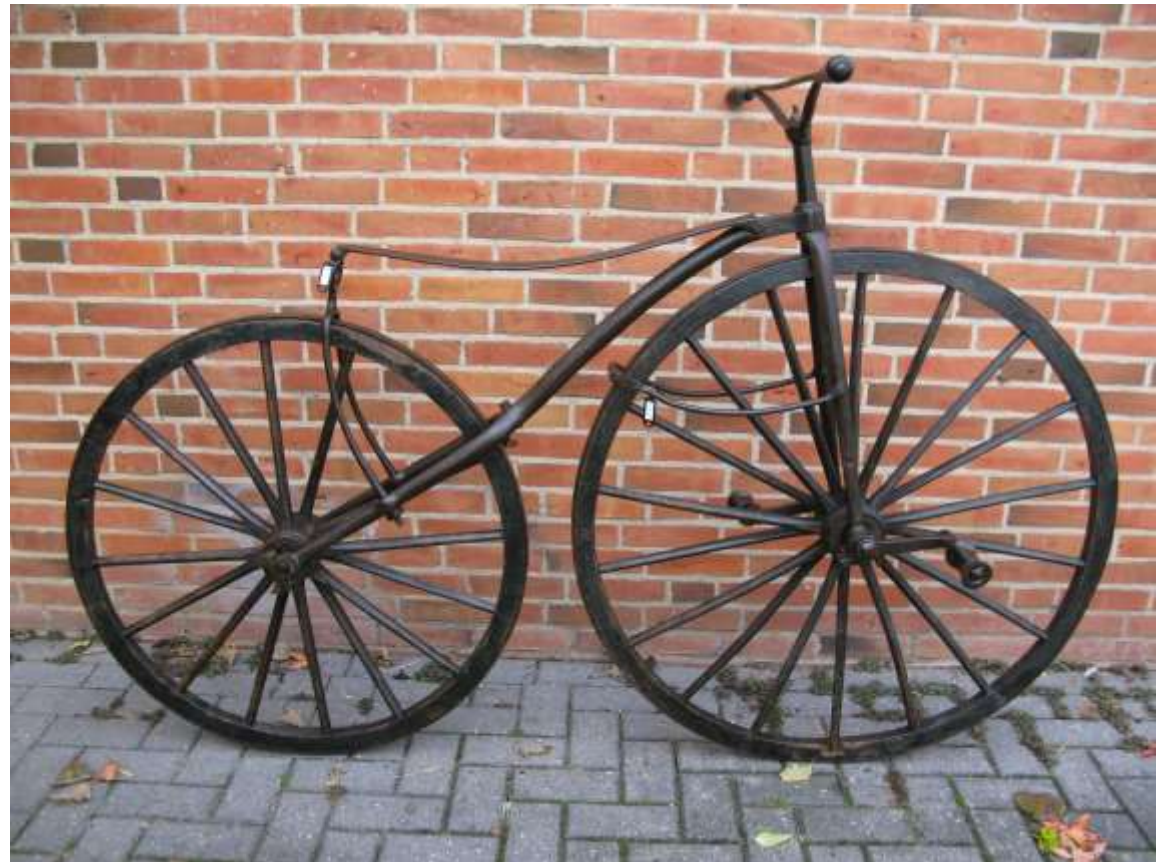
Burgers vélocipède 1872