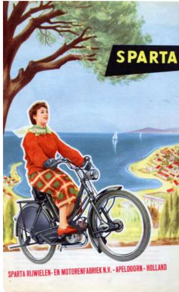
Sparta FP50 1953-1954

Sparta was de grootste fabrikant van bromfietsen in Nederland.