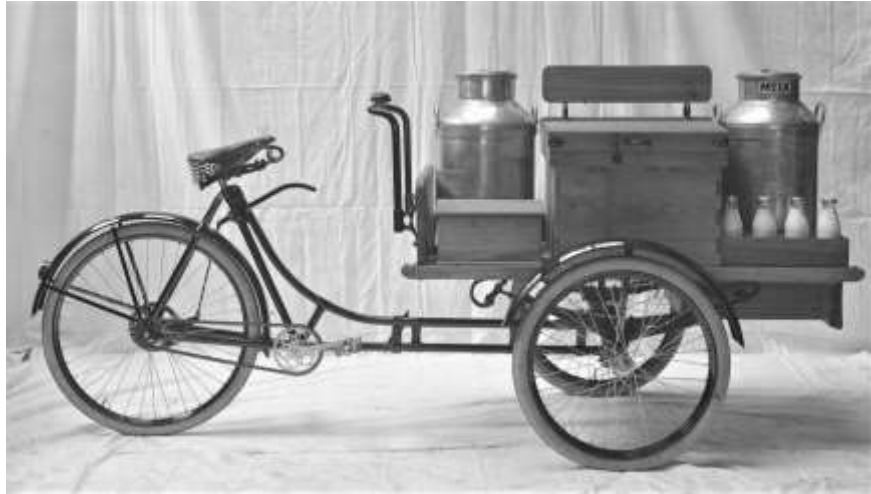
Bakfiets voor melktransport 1929