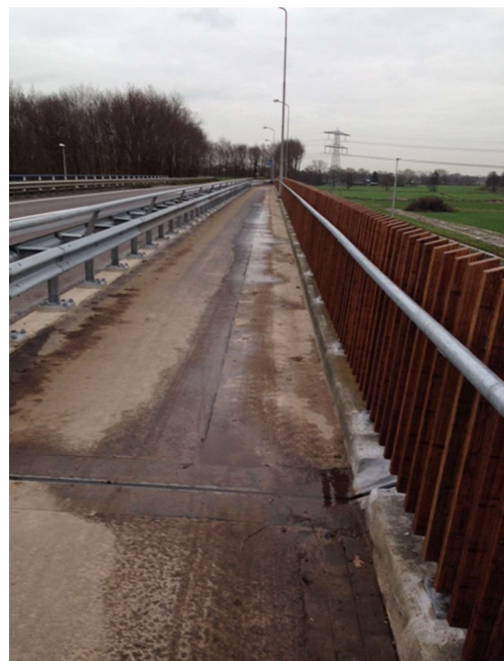
op het viaduct