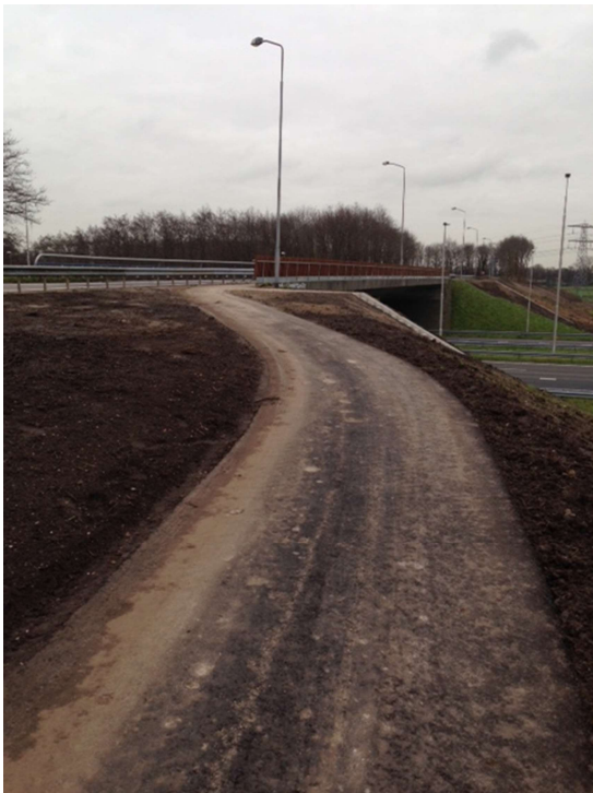
Oprit vanaf Zuidbroek

In blauw : het nieuwe stukje geasfalteerd fietspad van de Nieuwe Wetering, omhoog naar het viaduct van de A50 (Apeldoorn-Noord) en dan naar beneden naar de onderdoorgang bij de kruising Laan van Zodiac en oude Vellertweg aldaar. Steilheid valt nog mee.